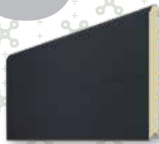
GRIS ANTHRACITE 7016